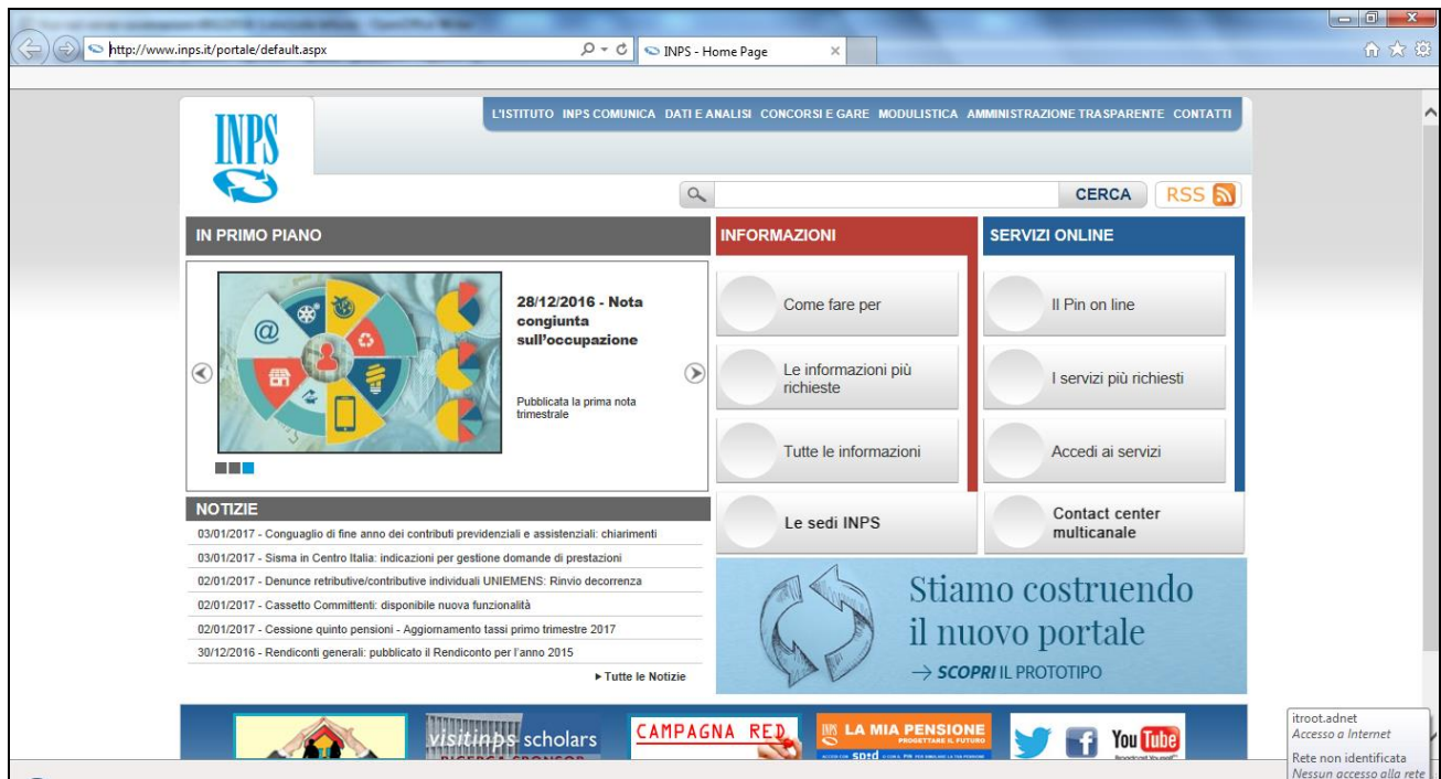
Figura 1: Portale Istituzionale