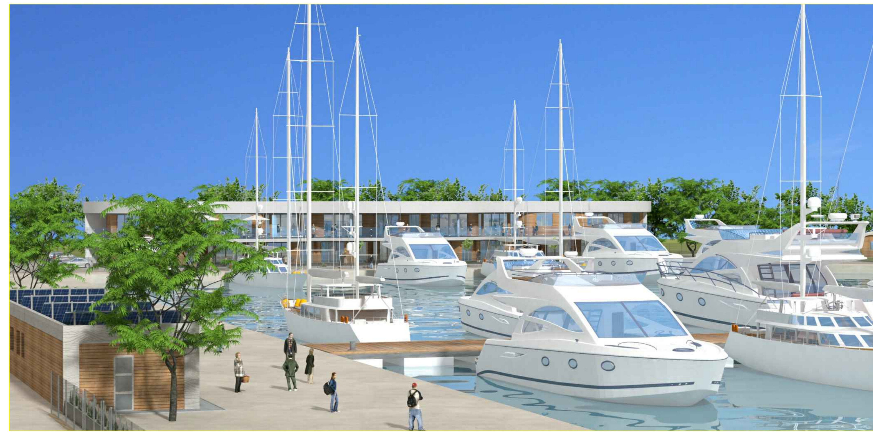
VISTA EDIFICIO SERVIZI - STATO PROGETTO