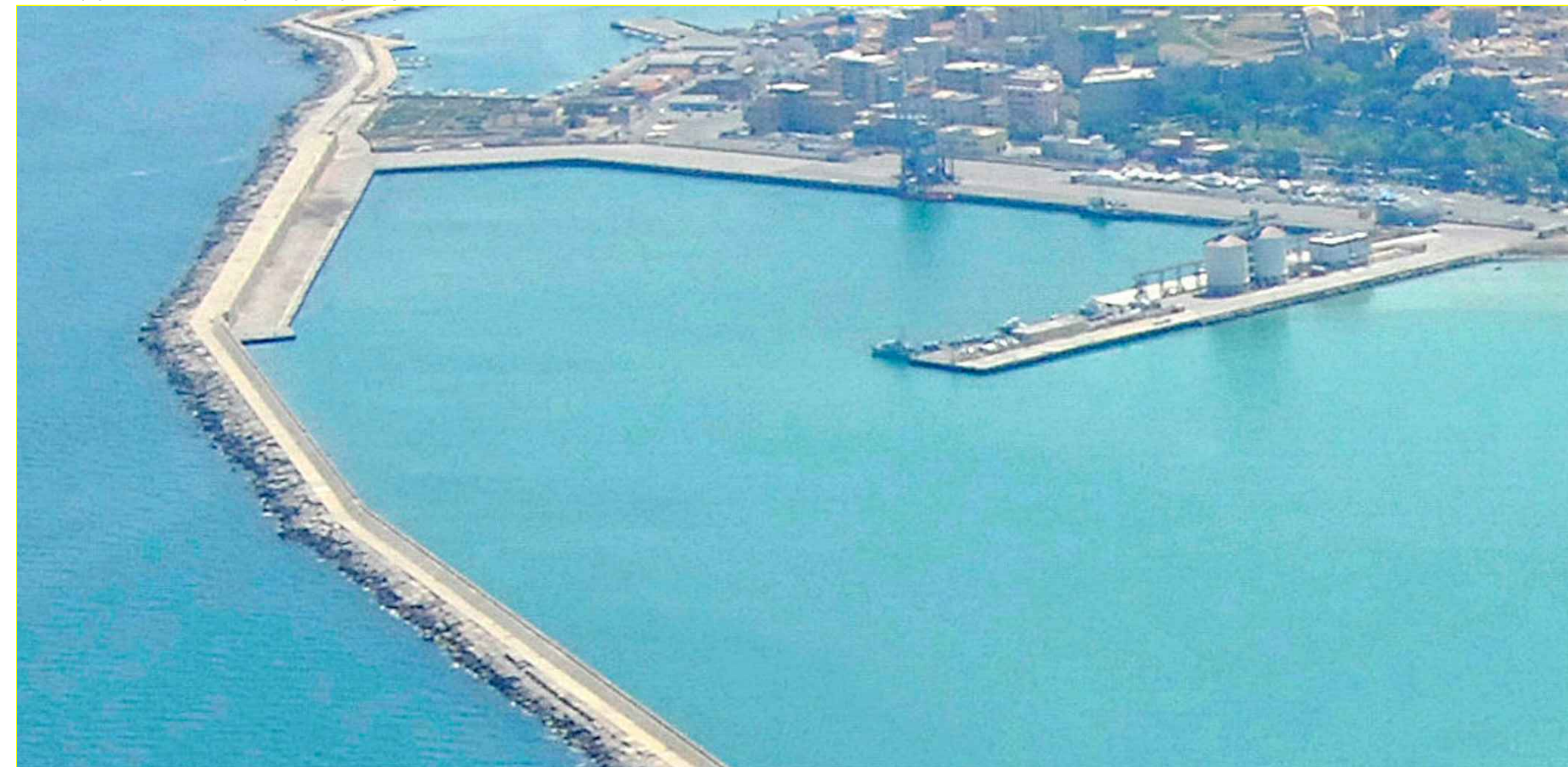
VISTA AEREA DA NORD - STATO ATTUALE