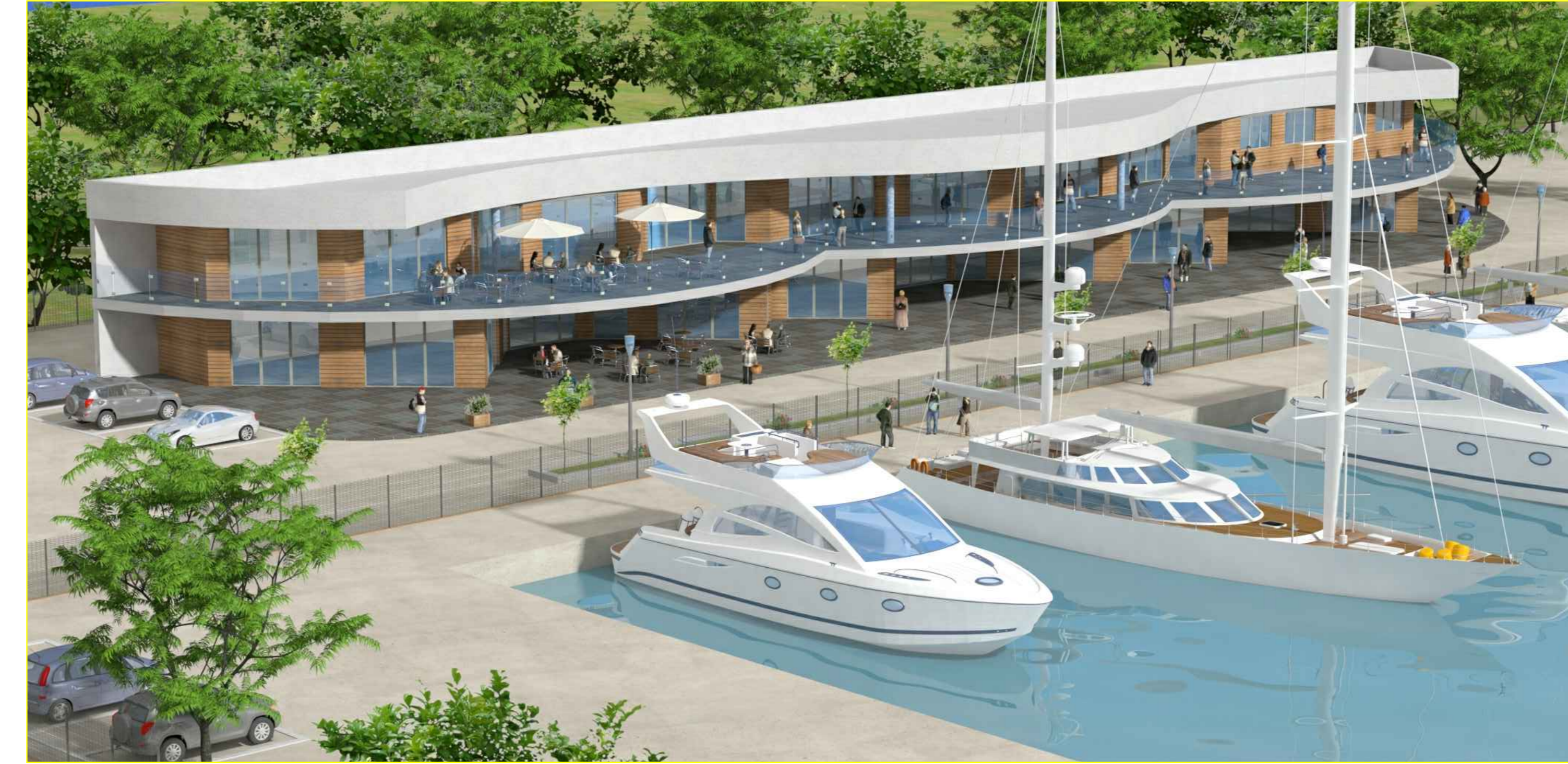
VISTA EDIFICIO SERVIZI - STATO PROGETTO