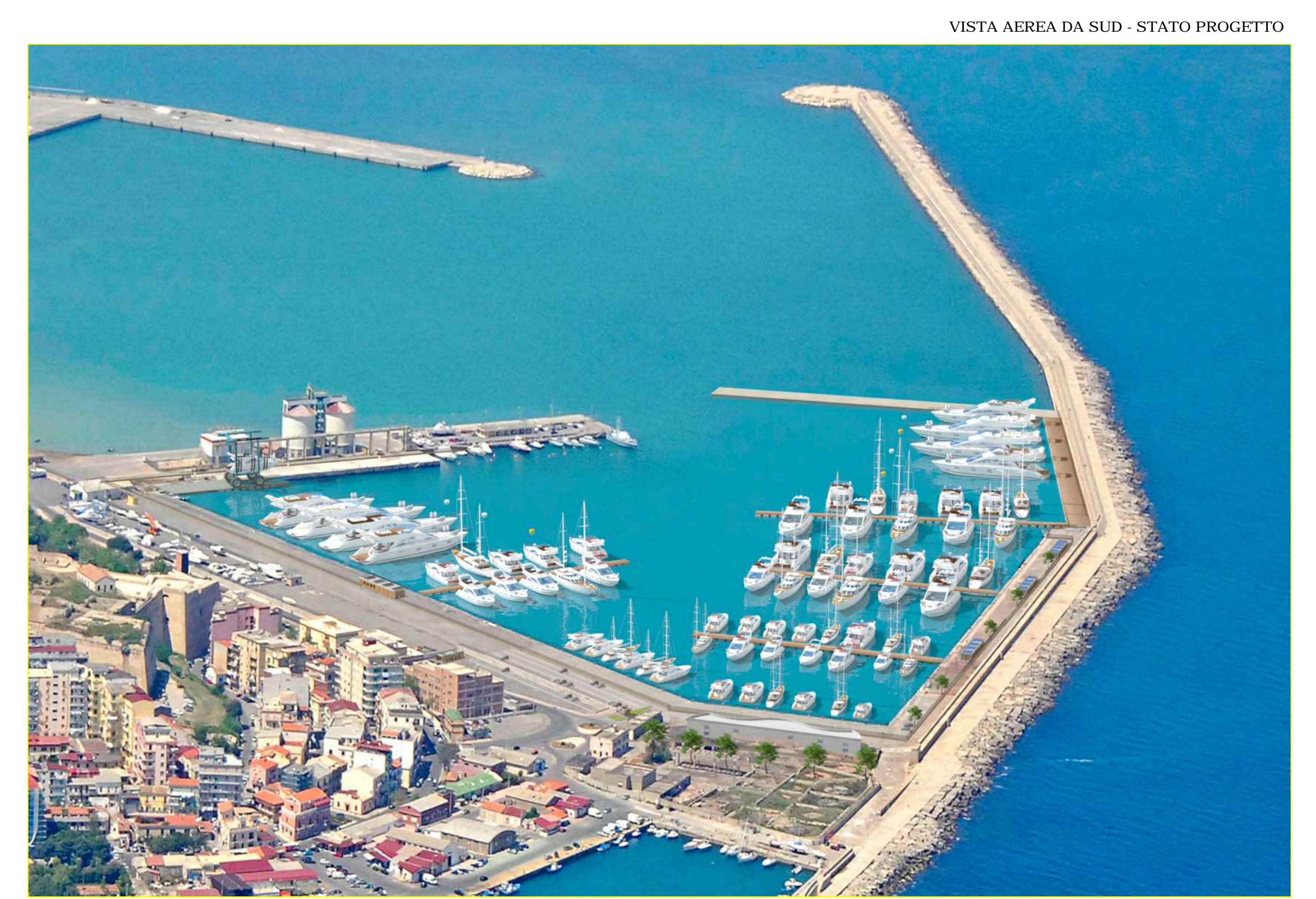
VISTA AEREA DA SUD - STATO PROGETTO